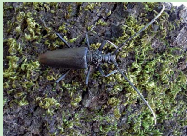
Grand Capricorne

Ces éléments auxquels s'ajoute la relative facilité de leur détection directe ou indirecte (trous de Grand Capricorne, crottes du Pique-prune) permettent d'utiliser ces espèces ensemble pour mettre en évidence la qualité de la forêt de plaine telle qu'elle est ou ses besoins de restauration. Par contre, la protection stricte du Grand Capricorne est malheureusement inadaptée : c'est un insecte commun et localement abondant au sud de la France et il faut considérer bien d'autres espèces de Coléoptères que celles présentes dans les listes d'espèces protégées pour repérer, en vue de leur conservation, tous les types de vieilles forêts. ■