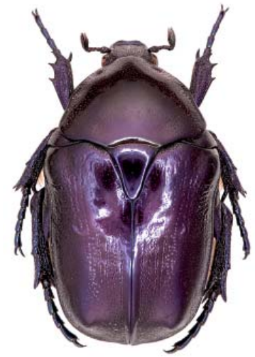
Grande Cétoine bleue

exigeants en vieux bois. Les Coléoptères répondent très bien aux opérations récentes de restauration (bois brûlés, coupes abandonnées ça et là, îlots non exploités, coupes en souches hautes) et à un réseau lâche mais largement réparti de vieilles forêts en réserve. Des espèces très rares considérées au bord de l'extinction ( Cucujus cinnaberinus , Tragosoma depsarium , Stephanopachys spp., etc.) recolonisent massivement ces espaces. En zone méditerranéenne, on doit au vin, à la corrida et au jambon de belota une situation originale